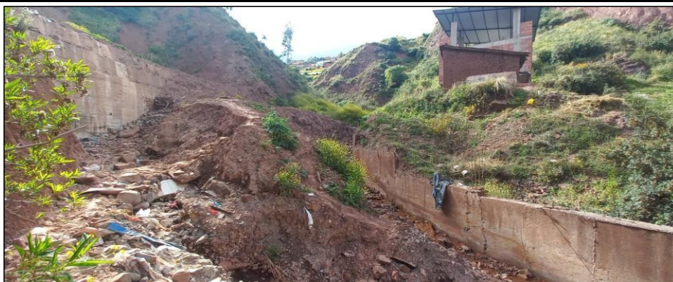
FIGURA N°01: TRAMO CRÍTICO EN LA QUEBRADA SOLTERO HUAYCO, DISTRITO DE CUSCO, PROVINCIA DE CUSCO - CUSCO, SE APRECIA EL CAUCE COLMATADO Y VIVIENDAS EN RIESGO.