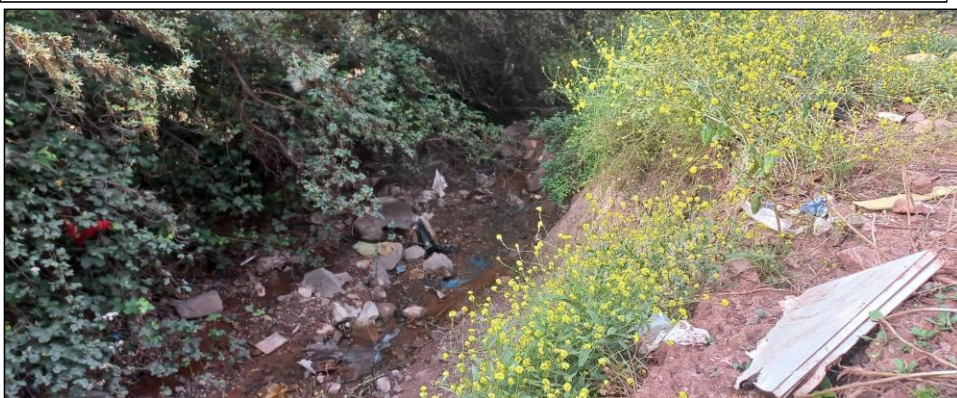
FIGURA N°02: TRAMO CRÍTICO EN LA QUEBRADA SOLTERO HUAYCO, DISTRITO DE CUSCO, PROVINCIA DE CUSCO - CUSCO, SE APRECIA EL CAUCE COLMATADO.